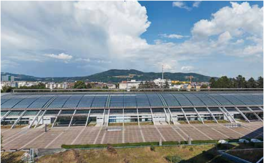
Design Center Linz © Jens Weber, München

AUVA-Unfallkrankenhaus Salzburg Institut für Anästhesie und Intensivmedizin 5010 Salzburg, Dr.-Franz-Rehrl-Platz 5 wolfgang.voelckel@auva.at